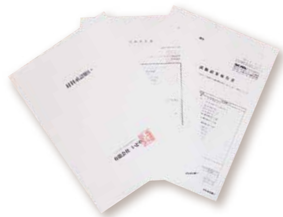
▲公共機関等への提出用「材料承認書」