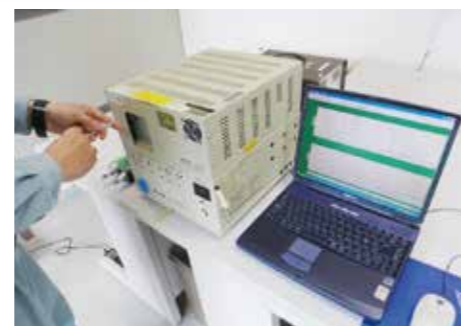
土壌ガス等の現場分析もお任せください