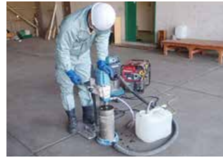
土間コンクリートや地下ピット下の土壌採取