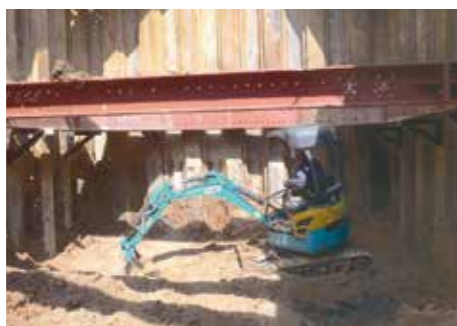
掘削除去等の浄化工事にも対応