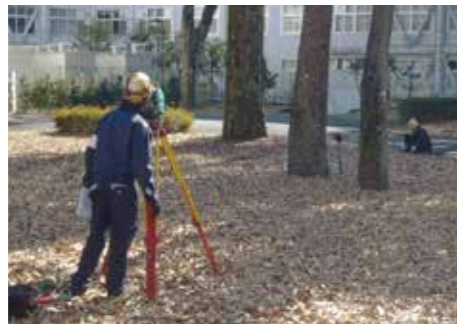
測量機器を用いて位置出し

測量から表層土壌採取・土壌ガス採取・現地分析・深度方向調査まで、現地土壌調査は当社にお任せください。狭小現場、工場、ガソリンスタンド、クリーニング店等の調査・浄化工事に至るまで、あらゆる現場に対応いたします。