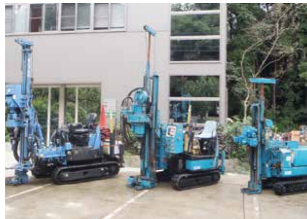
表層土壌から深度方向の土壌採取